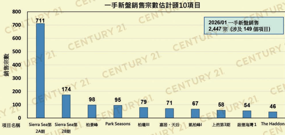
圖 1.1 銷售宗數按住宅項目統計

2. 二手住宅物業買賣合約註冊量: 4,127 宗(總金額 HK$305.67 億)