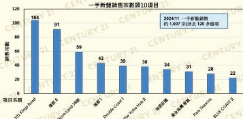
表 1.1 銷售宗數、銷售金額、平均呎價按住宅項目統計