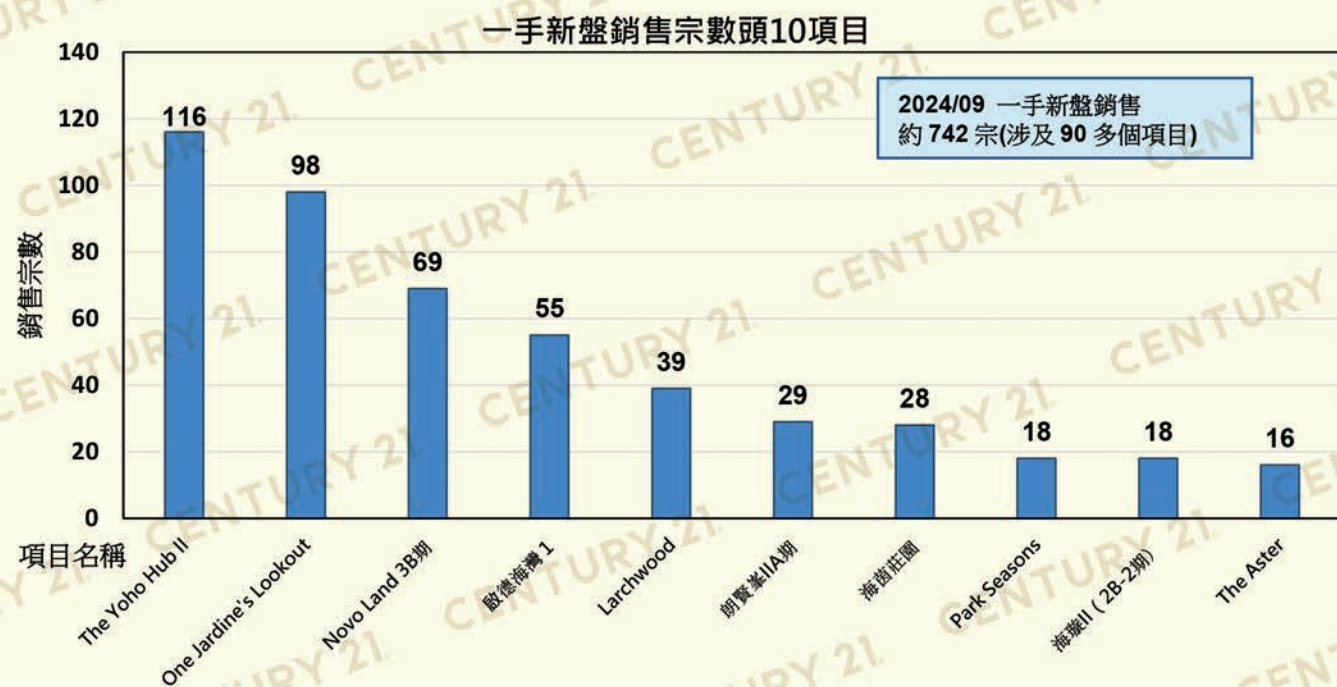
表 1.1 銷售宗數、銷售金額、平均呎價按住宅項目統計